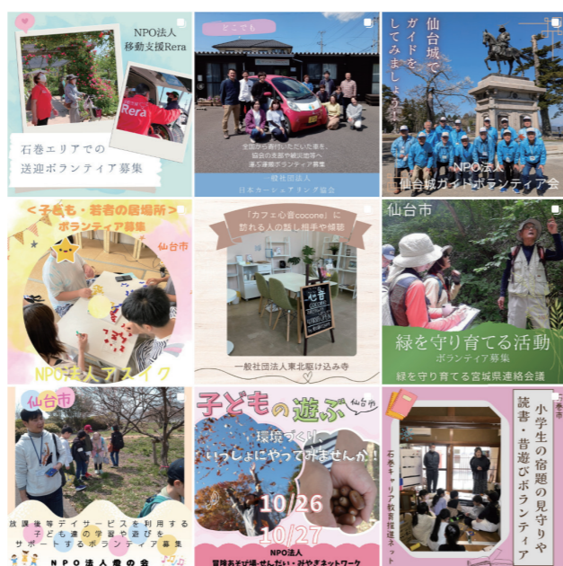
▲みやぎ NPO プラザも工夫しながら発信しています! (Instagram)

SNS は正しく運用すれば力強い味方です。皆さんも積極的に活用し、活動の輪を広げましょう。